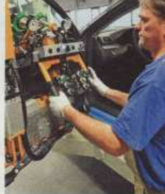
Autos aus Deutschland sind gefra

Mit dem MXS 5.0 von Ctek können nicht nur schwache Batterien wieder aufgeladen werden, sondern sogar tiefentladene. Erhöhte Spannungswerte – von maximal 15,8 Volt – führen dabei zu einer kontrollierten Gasbildung im Akku. Dadurch vermisch sich die Batteriesäure und die Kapazität steigt wieder an. ACE-Mitglieder können das Ladegerät in unserem E-Shop für 61 Euro im Internet bestellen www.ace-online.de/shop